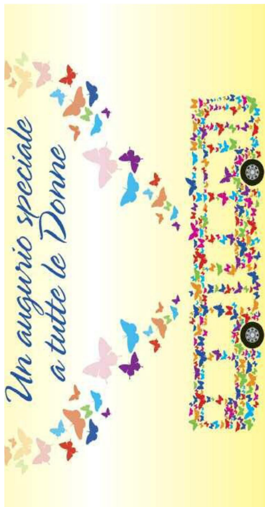
L'iniziativa è dei Trasporti pubblici luganesi

Una cartolina che promuove la Festa della donna insieme a un ramo di mimosa. È ormai tradizione che i Trasporti pubblici luganesi dedichino un omaggio, per la loro ricorrenza, all'altra metà del cielo. Questa volta dando spazio e visibilità anche all'Associazione consultorio e Casa delle donne di Lugano. L'8 marzo utenti e passanti potranno così contribuire ai diversi progetti. Questo dalle 7.30 alle 9.30 e nel pomeriggio fra le 16 e le 18 alla fermata Lugano Centro e in centrocittà.